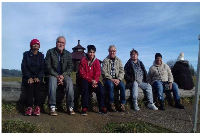
zábery z návštevy múzea v Ždiari