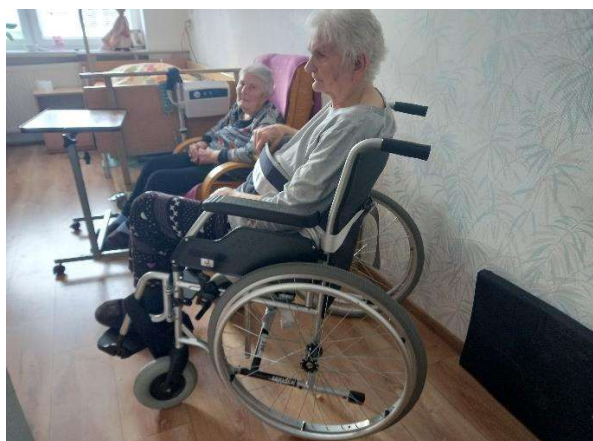
mechanický invalidný vozík