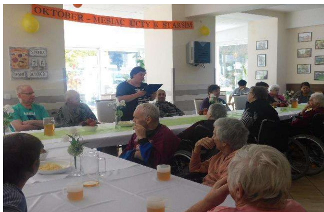
Úcta k starším - posedenie s prijímateľmi

Dňa 27.10.2022 návšteva cintorína keďže sa blíži sviatok všetkých svätých a sviatok spomienky na zosnulých, aj my sme si chceli uctiť pamiatku na ľuď, ktorí časť svojho života prežili v našom zariadení a sú pochovaní na miestnom cintoríne. Spoločne sme zapálili sviečky, položili kvety a pomodlili sa.