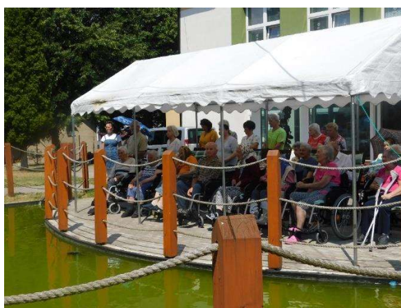
odpustová slávnosť – sv. omša z príležitosti sviatku Matky Ustavičnej pomoci