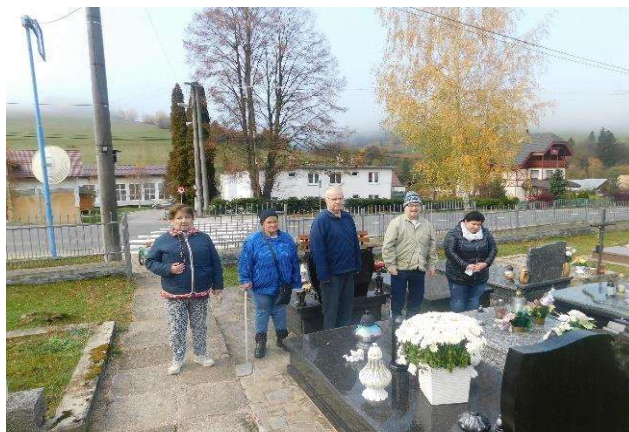
návšteva cintorína v Spišských Hanušovciach

Dňa 27.10.2022 návšteva cintorína keďže sa blíži sviatok všetkých svätých a sviatok spomienky na zosnulých, aj my sme si chceli uctiť pamiatku na ľuď, ktorí časť svojho života prežili v našom zariadení a sú pochovaní na miestnom cintoríne. Spoločne sme zapálili sviečky, položili kvety a pomodlili sa.