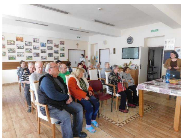
prednáška a prezentácia pre prijímateľov z príležitosti Dňa zeme