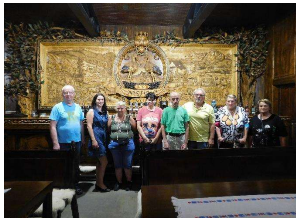
expozícia v Nestville parku v Hniezdom

Dňa 5.8.2022 hodina ovocia na tému nektarinka pekné doobedie sme strávili vonku na terase pri rybníku. Počas hodiny ovocia sme si s PSS prečítali zaujímavosti o nektarinkách. Majú nízky obsah kalórií, obsahujú antioxidanty, rastlinné živiny, minerálne látky a vitamíny C, A, B-komplex a mnoho ďalších zdraviu prospešných látok. Nakoniec sme si na sladkom a šťavnatom ovocí spoločne pochutili.