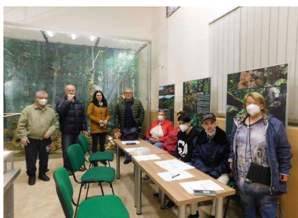
múzeum pieninskej prírody v Spišskej Starej Vsi