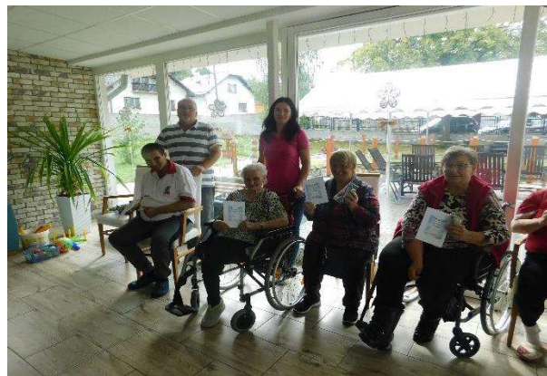
športová olympiáda prijímateľov