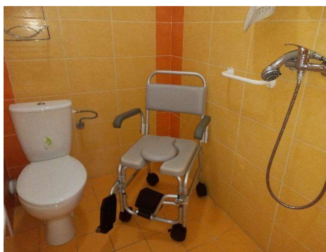
toaletný sprchovací vozík pre prijímateľov