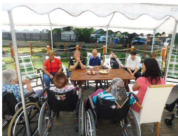
priebeh hodiny na tému letného ovocia – nektarinka