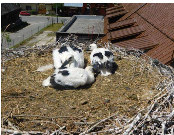
prijímatelia spolu s pracovníkmi PIENAPU pri bocianoch