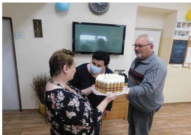
tanečné popoludnie s prijímateľmi – katarínska zábava

Dňa 6.12.2022 slávenie sviatku sv. Mikuláša , deň svätého Mikuláša nám spríjemnili deti z materskej školy Spišské Hanušovce, ktoré si pod vedením svojich pani učiteliek pripravili krásne pesničky a básničky. Všetkým prijímateľom vyčarili úsmev na tvári a potešili srdce. Mikuláš potom každého obdaroval sladkým balíčkom.