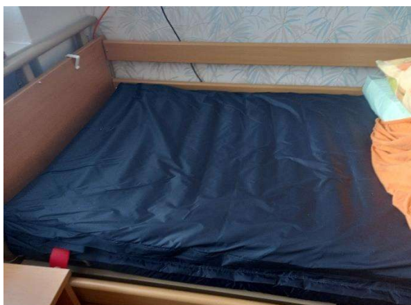
aktívny antidekubitný matrac

Na základe podpísanej Zmluvy č. 2022/04OB050 zo dňa 9.8.2022 sme zakúpili 5 ks aktívnych antidekubitných matracov ARMONY/ 400,00 € 1 ks spolu vo výške 2.000,00 €, 5 ks mechanických invalidných vozíkov Meyra/ 227,65 € 1 ks spolu vo výške 1.138,25 €, 5 ks toaletných sprchovacích vozíkov / 269,00 € 1 ks spolu vo výške 1.345,00 €. Prílohou k projektu bola fotodokumentácia, súhlas so spracovaním osobných údajov. Po realizácii projektu sme v decembri zaslali záverečnú správu.