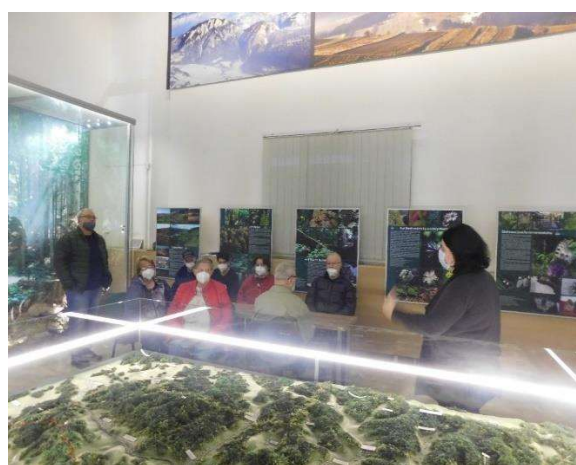
múzeum pieninskej prírody v Spišskej Starej Vsi