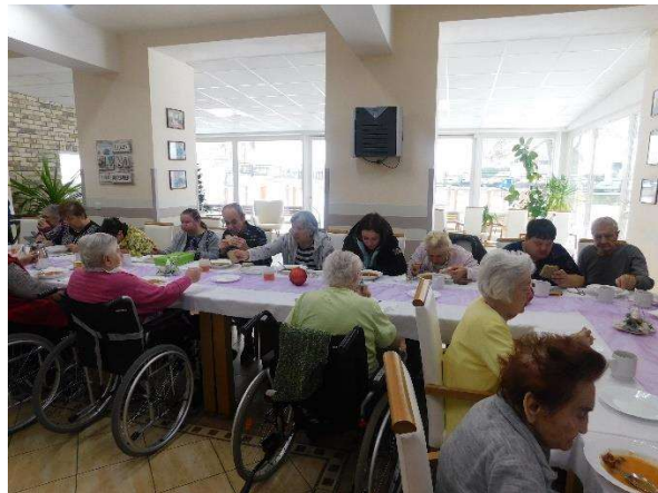
zábery zo spoločného posedenia prijímateľov pri jedličke