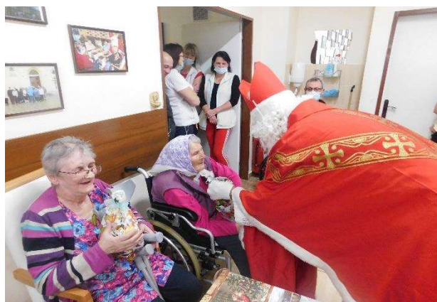
Mikuláš medzi prijímateľmi, ktorých obdarúva mikulášskymi balíčkami

Dňa 20.12.2022 spoločné posedenie s prijímateľmi pri jedličke v tento krásny predvianočný čas sme v dopoludňajších hodinách strávili spoločne v kruhu s prijímateľmi, ktorí si pre nás spolu s pracovnými terapeutmi pripravili vianočné koledy a program, ktorým nám urobili veľkú radosť a naladili nás na najkrajšie sviatky v roku Vianoce. V závere sme sa im poďakovali a každému popriali požehnané a milostiplné vianočné sviatky.