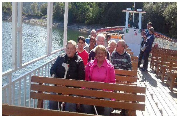
výlet do neďalekého Poľska

Dňa 14.9.2022 športová olympiáda pracovní terapeuti usporiadali pre prijímateľov športovú olympiádu, ktorej heslom bolo : „Nie je dôležité vyhrať, ale zúčastniť sa.“ Súťažilo sa v piatich disciplínach : vešanie šatiek, namotávanie, hod loptičkou do vedra, hod kruhmi na terč a kolky. U všetkých bolo vidieť nadšenie a aj to, že majú súťaživého ducha. Všetci mali dobrú náladu a na záver dostali diplom a sladkú odmenu.